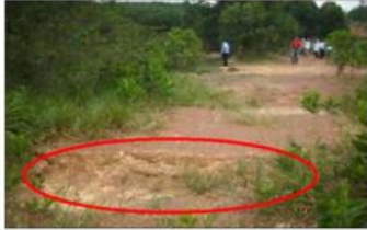
Kawasan Yang Sepatut Dipajak Kepada Lamberts - Jalan Perimeter Mendap (08.03.2011)