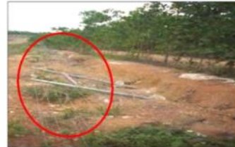
Kawasan NFCorp - Pagar Berangkai Tumbang (08.03.2011)