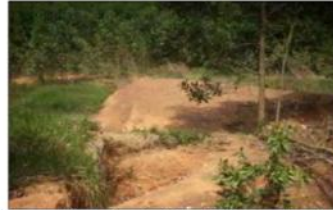
Kawasan Yang Sepatut Dipajak Kepada Lamberts - Jalan Perimeter Ditumbuhi Pokok Acacia (08.03.2011)