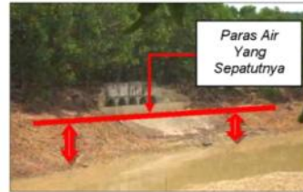
Kawasan NFCorp - Paras Air Menjadi Cetek Di Kolam Takungan Akibat Benteng Runtuh (08.03.2011)