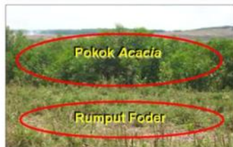
Kawasan NFCorp - Kawasan Foder Ditumbuhi Acacia (08.03.2011)