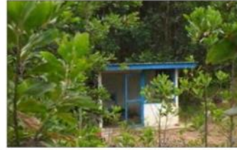
Kawasan Yang Sepatut Dipajak Kepada Lamberts - Rumah Pam Air Yang Belum Digunakan (08.03.2011)

Pada pendapat Audit, kelewatan/kegagalan menandatangani perjanjian boleh menjejaskan kepentingan Kerajaan. Selain itu, kawasan yang telah dibangunkan perlu dimajukan supaya pembaziran dapat dielakkan dan Kerajaan mendapat value for money bagi kos pembangunan yang telah dibelanjakan.