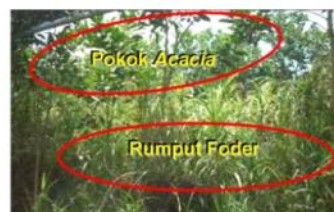
Kawasan NFCorp - Pokok Acacia Menutupi Rumput (08.03.2011)