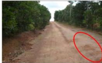
Kawasan NFCorp - Jalan Masuk Berlopak (08.03.2011)