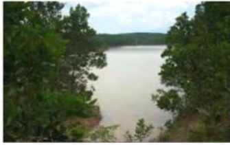
Kawasan Yang Sepatut Dipajak Kepada Lamberts - Kolam Takungan Yang Belum Digunakan (08.03.2011)